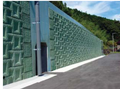
斜壁多数アンカー式補強土壁