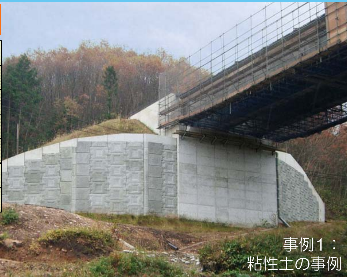
事例1： 粘性土の事例